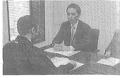
中小企業の経営相談に対応する専門家(写真奥2人)

は、あいち産業振興機構が運営。現在、専門家が名古屋本部に13人、豊橋サテライトに9人在籍している。17年度の愛知県よろず支援拠点は、16年度の途中で開設したサテライト窓口「豊橋サテライト」が通年稼働したことから来訪相談者数が増加。また、事業開始から4年目を迎えて認知度が高まり、金融機関など